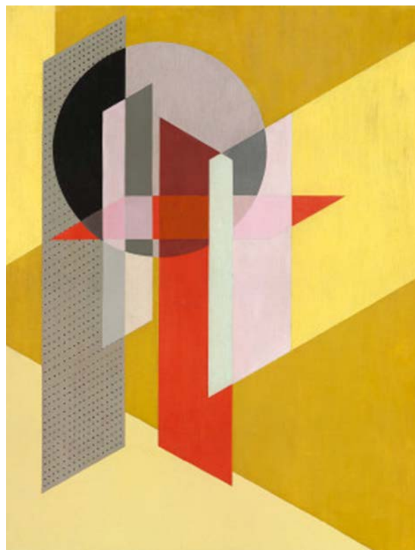
László Moholy-Nagy. Z VII (1926). Pintura a l'oli de la sèrie «Z».