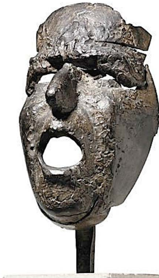
Juli González. Màscara de Montserrat cridant (1939). Bronze fos, 32,8 × 14,9 × 12 cm.

Observeu la imatge següent. Fixeu-vos també en l'any i el títol.